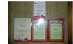
НАГРАДЫ МУЗЕЙНОЙ КОМНАТЫ