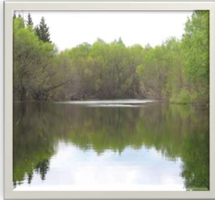
Один из прудов в Растовом саду