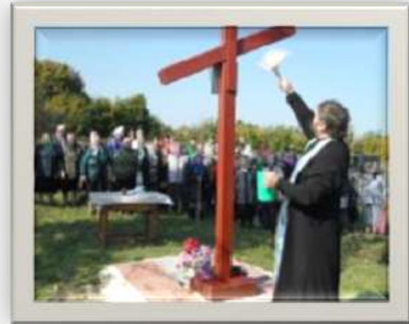
Церковь Введение во храм Пресвятой Богородицы

Село Заворонежское начинает свой исторический отсчёт с 1863 года. Ныне действующая здесь кирпичная церковь строилась на средства прихожан 10 лет — с 1891 по 1901 год. После Великой Отечественной войны были попытки властей закрыть Заворонежскую церковь и использовать её как склад под зерно. Но местные женщины закрыли алтарь на замок и не пустили туда представителей власти. Весь иконостас жители забили досками, защитив его от повреждения. Более того, прихожане поехали в Москву и благодаря земляку попали на приём к председателю ВЦИК М. Калинину, который разрешил продолжить богослужение. В то время храм был единственным в районе.