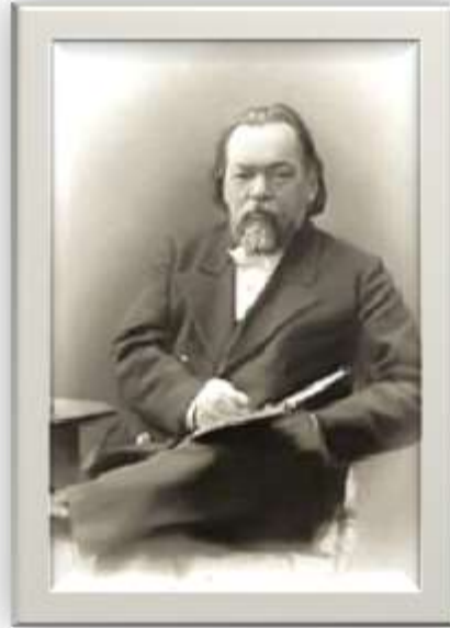
Федор Никифорович Плевако