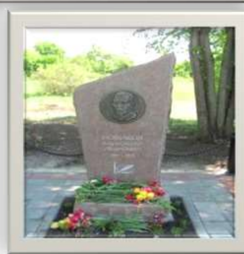
Новиковский социокультурный комплекс