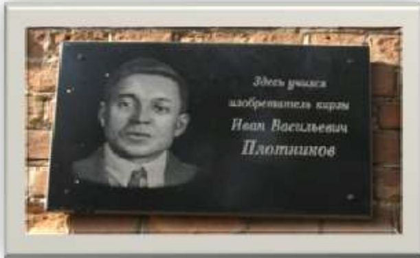
Мемориальная доска на здании профессионального училища

Россия является крупнейшим в мире производителем кирзы. Около 85 % современного производства кирзы в России предназначено для изготовления армейской обуви. Всего к настоящему времени произведено около 150 миллионов пар кирзово-вой обуви.