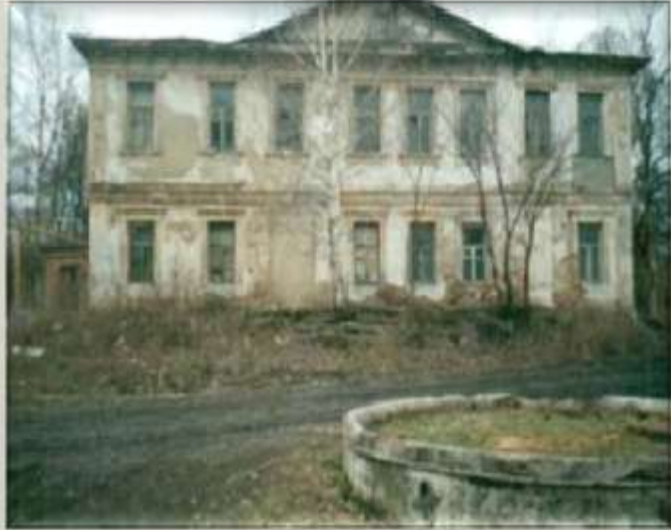
На берегу реки Вишневки сохранился его усадебный дом